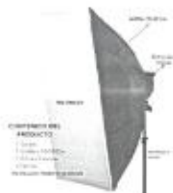
Sombrilla Blanca con Negro de 83cm