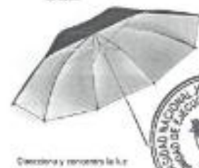
Dirigida y concentra la luz